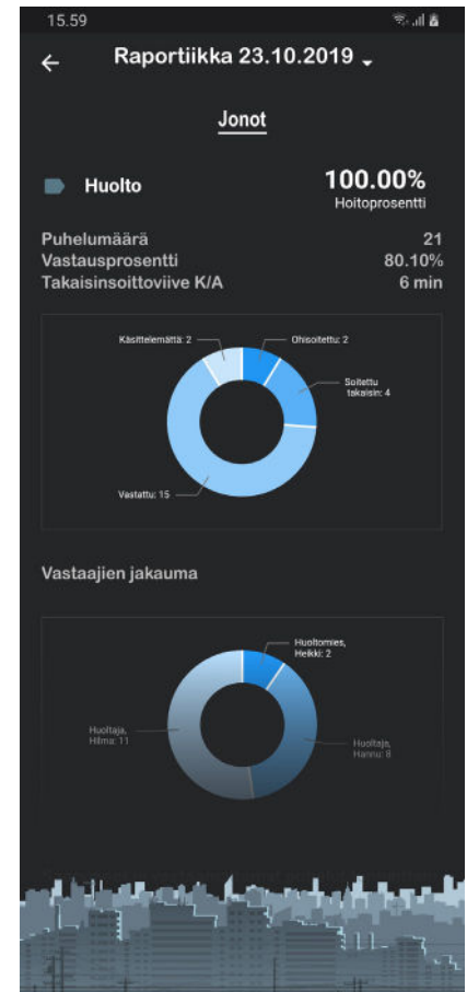
Kuva 3. Mustalinjassa on ainoastaan laatuinen raporttiikkatoiminto.

Yksi asia, jota kannattaa myös vertailla, on mobiilivaihteen asiakaspalvelu. Haluatko tehdä mahdollisimman paljon itse, esimerkiksi lisätä käyttäjiä tai asettaa henkilökunnan lomavastaajia internetissä toimivasta portaalista tai näppäinkoodeilla? Vai haluatko, että jokainen käyttäjä voi päivittää mahdollisimman pitkälle omat tietonsa itse, esimerkiksi läsnäolotilan ja lomavastaajan?